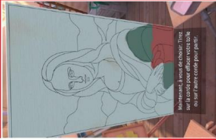
Atelier de dessin virtuel