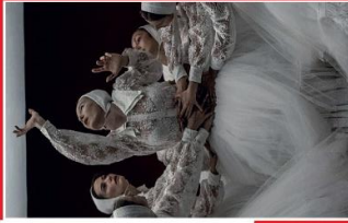
Image de la collection textile