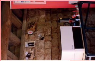
Atelier de découpeuse laser