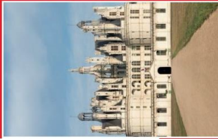
Château de la Loire